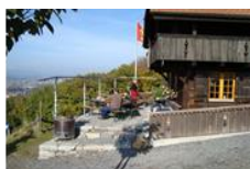
Das isch's Hüsi