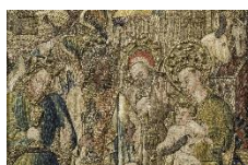
Altar aus Seide...